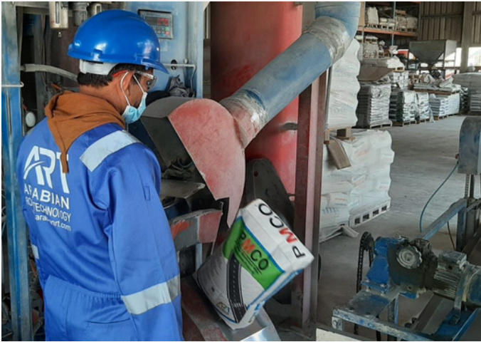
تم تصنيع PMCO وفقًا لمعايير ايزو 9001-2010، مما يضمن الجودة العالية في كل مرحلة.

تعتبر التراكبات الأسمنتية الدقيقة المعدلة بالبوليمر PMCO™ التي يتم تصنيعها في دبي- الإمارات العربية المتحدة، بواسطة الشركة العربية لتقنية الطرق (ART) حلاً تحويليًا مصممًا بدقة لمواجهة التحديات التي لا تعد ولا تحصى التي تصيب الأسطح الأسفلتية التقليدية. تعتبر PMCO™ بمثابة درع لحماية الاسطح من التآكل لمدة تزيد عن 10 عامًا، مما يضع معيارًا لا مثيل له في المتانة وطول العمر. مدعومة بثقة شركة (ART) في أدائها، فإن شركة (ART) تقدم ضمانًا مشروطًا لتماسك المادة لمدة 0 سنوات، مما يعكس التزامها الثابت بالجودة والموثوقية.